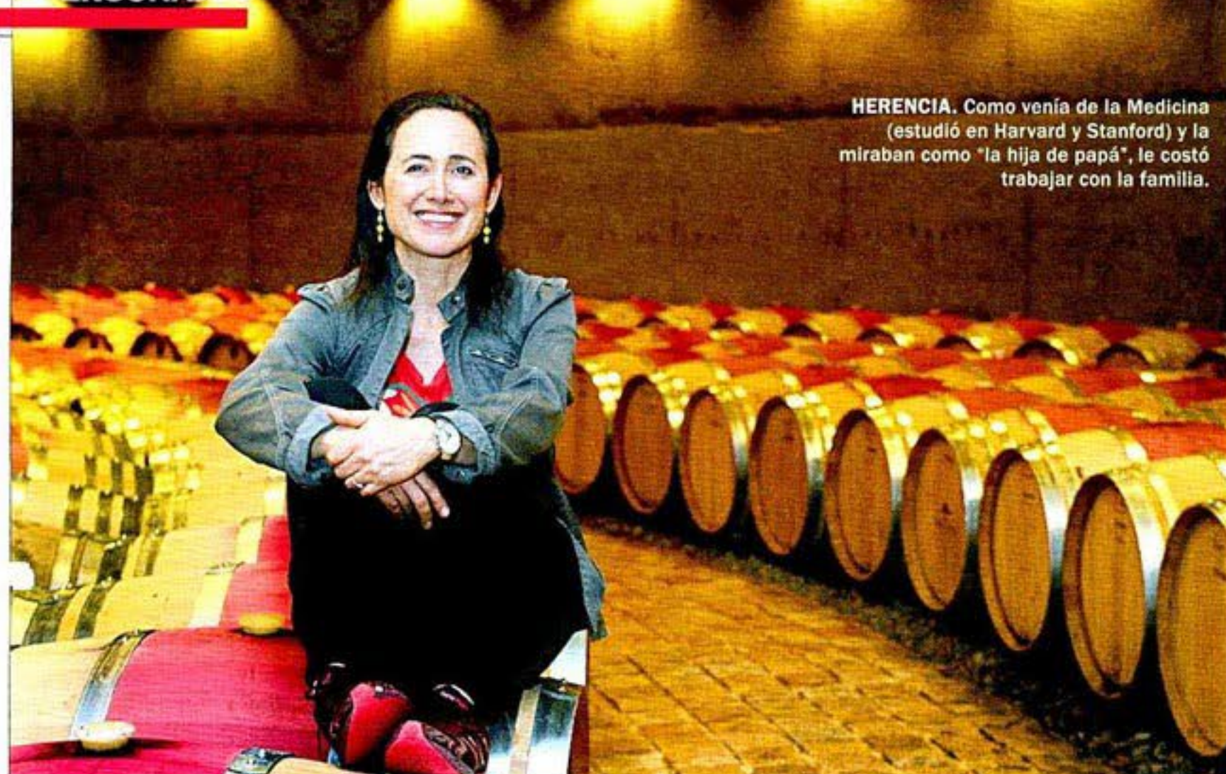
HERENCIA. Como venía de la Medicina (estudió en Harvard y Stanford) y la miraban como “la hija de papá”, le costó trabajar con la familia.

corriendo. Tengo una visión de mi marido y yo de viaje caminando los dos rapidito, con un bastoncito. Mi marido me dice que no le diga eso, él es deportista y juega al golf, pero para mí es una visión romántica.